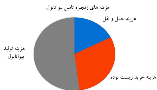
شکل ۲. سهم بیشترین هزینه های زنجیره تامین.