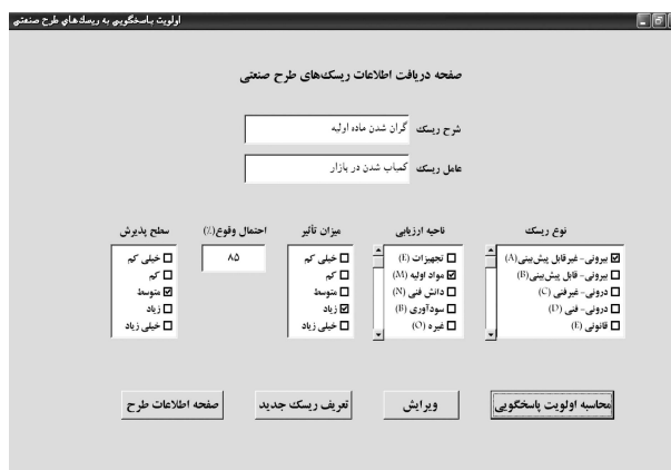
شکل ۳. صفحه‌ی دریافت اطلاعات ریسک طرح صنعتی.

با توجه به ذخیره‌سازی اطلاعات و نتایج ارزیابی ریسک هر طرح صنعتی در پایگاه دانش مربوط به بانک داده، به‌کارگیری اطلاعات طرح‌های قبلی در تحلیل ریسک طرح‌های جدید ممکن می‌شود. بنابراین پس از مدتی این امکان فراهم خواهد شد تا در مورد ریسک‌های مختلف و احتمال وقوع و تأثیر آن‌ها داده‌های آماری جمع‌آوری شوند. علاوه بر آن که هر سازمان می‌تواند به‌راحتی چنین بانک داده‌ی را برای خود ایجاد کند، در سطوح بالاتر نیز سازمان‌های دولتی و ارائه‌کنندگان خدمات سرمایه‌گذاری می‌توانند از فواید در اختیار داشتن چنین بانک داده‌ی بهره‌گیرند. مثلاً سازمان‌های بزرگی از قبیل وزارت‌خانه‌ها می‌توانند اطلاعات طرح‌های مختلف را در